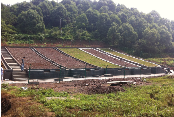
图1 试验布设的5个径流小区

试验时长10个月,从第一年8月至第二年6月。监测期间,若当次降水发生产流或日降水量大于10 mm,则进行数据采集;若连续数天降水,则分别观测记录每天的降水量和水土流失量。每次取样时,首先记录各径流小区集流池内水的体积;然后将集流池内的水搅拌均匀,用试剂瓶取出1 000 mL,将试剂瓶静置一周后,倒去上清液,洗出悬移质,烘干称量,计算泥沙质量;最后根据径流量计算泥沙浓度,作为此次的土壤流失量,并记录取样时间内对应的降水量。采样完毕后,